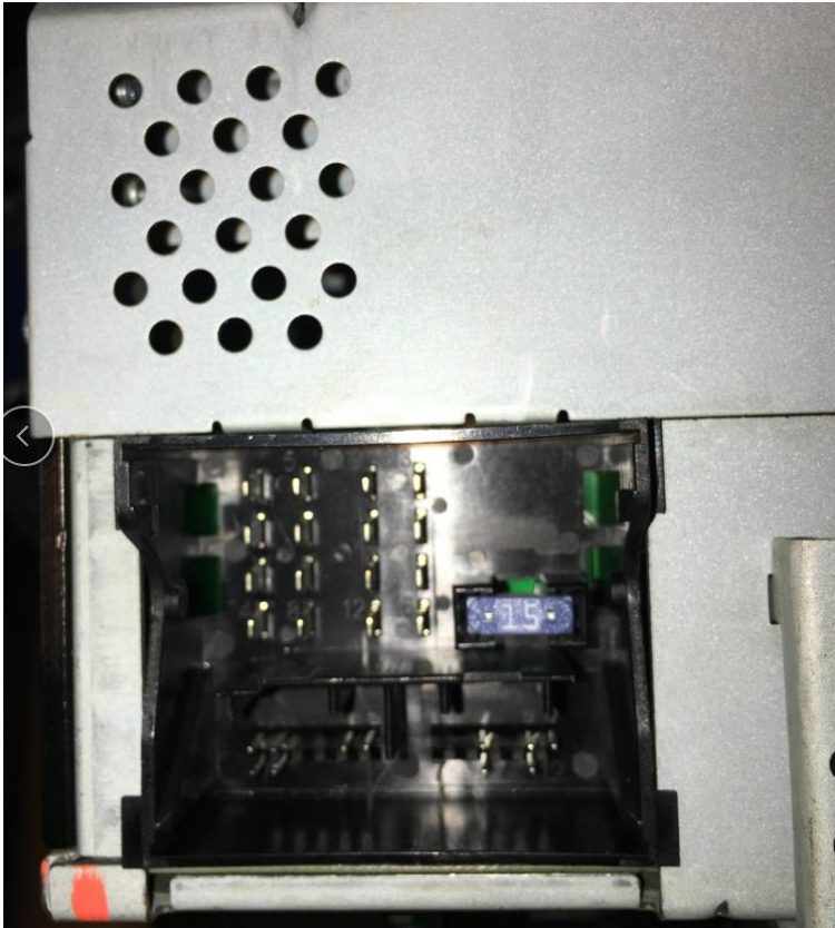
福特蒙迪欧致胜车型(原车主机尾座)